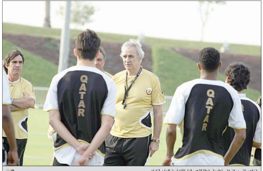
ت فوساتي يركز على تطبيق خطة اللعب قبل لقاء استراليا ب 3 ايام

معمدا على التدريبات المكثفة التي يؤديها اللاعبون في هذا المعسكر حيث يعتمد الفريق على مجموعة اللاعبين المحترفين الذين سيصلون إلى ملبورن قبل لقاء قطر بثلاثة أيام لارتباطهم بمباريات رسمية مع اندبنتهم الأوروبية وخصوصا اللاعبين المحترفين في الدوري الإنجليزي.